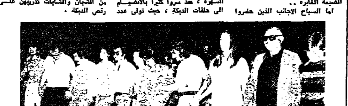
لبنانيون واجانب ومحاوله للاشتراك في حفلة بكرة